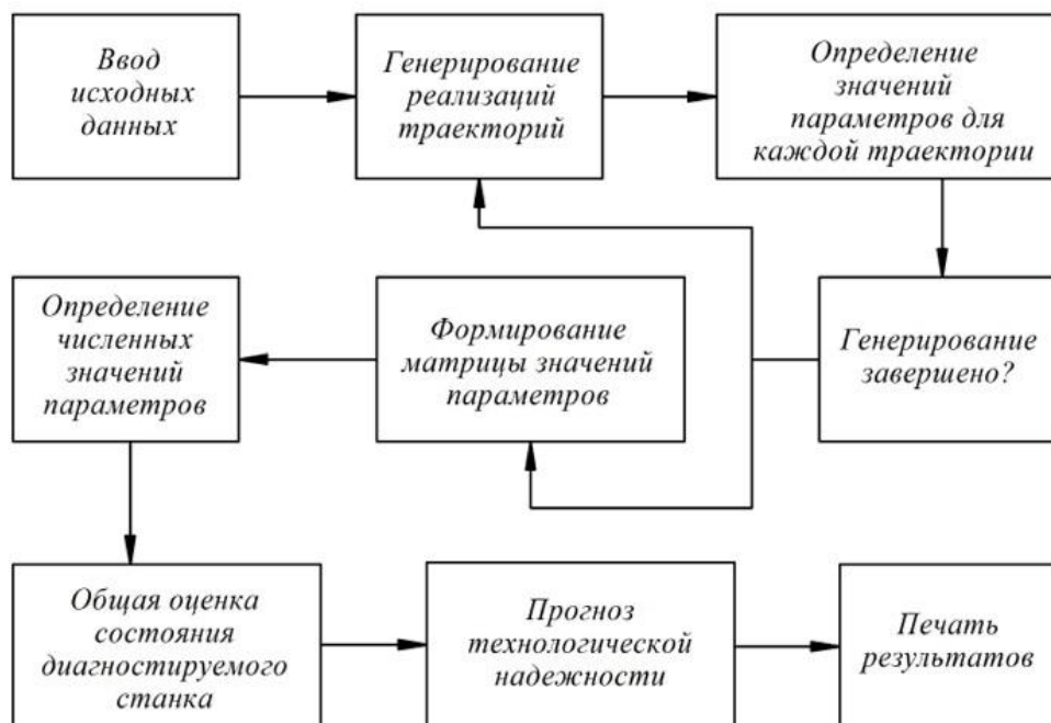
Рис 1. Алгоритм анализа траекторий формообразующей точки инструмента, закрепленного в суппорте, по управляющим параметрам.

Введенные данные должны однозначно задать условия реализации и параметры траектории формообразующего узла на основе которых будет осуществлен сбор и последующая обработка диагностической информации.