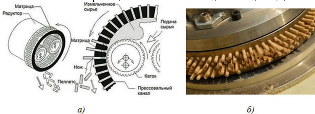
Рис.1. Работа гранулятора с цилиндрическими матрицами:

Пресс-гранулятор представляет собой аппарат (рис.1), в котором подготовленное влажное сырье продавливается специальными катками через матрицы, имеющие отверстия определенного диаметра. Под действием давления и неизбежного повышения температуры выделяемый из древесины лигнин выполняет прочное склеивание мельчайших фрагментов в достаточно плотную структуру пеллет цилиндрической формы. Пресс-грануляторы выпускаются с двумя типами матриц: с цилиндрической и плоской. После каждого оборота матрицы получаемые пеллеты срезаются специальным ножом. Такая технология изготовления позволяет производить топливные пеллеты одинаковой длины [4].