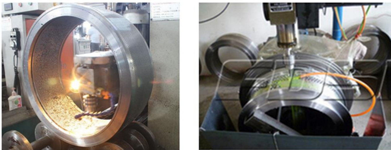
Рис.2. Сверление отверстий в цилиндрической матрице:

Передовые фирмы по производству пресс-грануляторов [5,6] процесс изготовления основной детали, цилиндрической матрицы, выполняют на станках с ЧПУ (рис. 2).