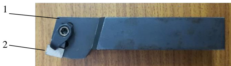
Рис.1 Общий вид экспериментального резца 1 - корпус резца, 2 - пластина из композита

Из образца композиционного материала, представленного лабораторией прецизионных материалов, электроэрозионной обработкой был вырезан призматический образец, из которого на универсально-заточном станке была изготовлена режущая часть ( \alpha=10^\circ , \alpha'=10^\circ , \gamma=0^\circ ) сборного токарного резца (рис.1).