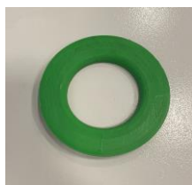
Рис. 1. Матрица, изготовленная с помощью FDM печати

В представленной работе исследуется влияния упругого пружинения FDM штампа на точность изготовления изделий вытяжкой. Эксперимент проводился на жестком штампе. В штамп установили: жесткий инструмент и инструмент, изготовленный с помощью FDM печати. FDM инструментом для вытяжки деталей являлась матрица (рис. 1). С помощью листовой штамповки выполнялась вытяжка деталей (рис. 2 – 3) из материалов: алюминий АД1, медь М3 и сталь 20Х13.