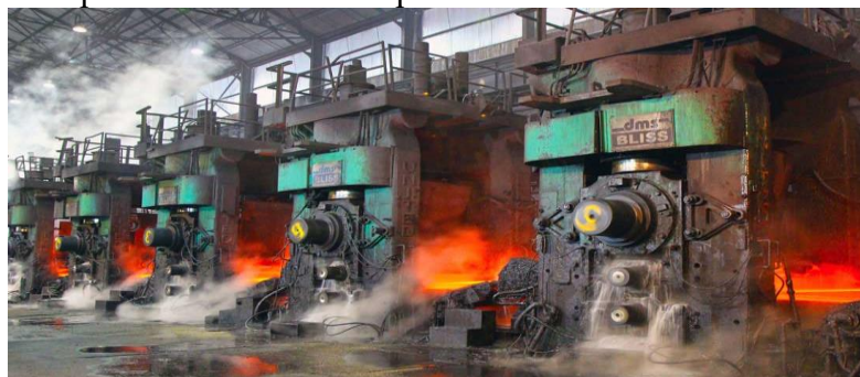
Рис. 1. Широкополосный стан горячей прокатки

До сих пор в промышленности, связанной с чёрной и цветной металлургией, основное место занимает прокатное производство, которое позволяет получить большой спектр разнородной продукции, начиная со стальных листов и заканчивая специальными изделиями разной степени сложности. Одними из главных локомотивов данной отрасли являются широкополосные станы горячей прокатки (рисунок 1), которые обеспечивают широкие потребности промышленности и строительства.