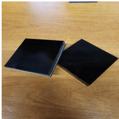
Рис. 1. Полиуретановый и армированный образцы