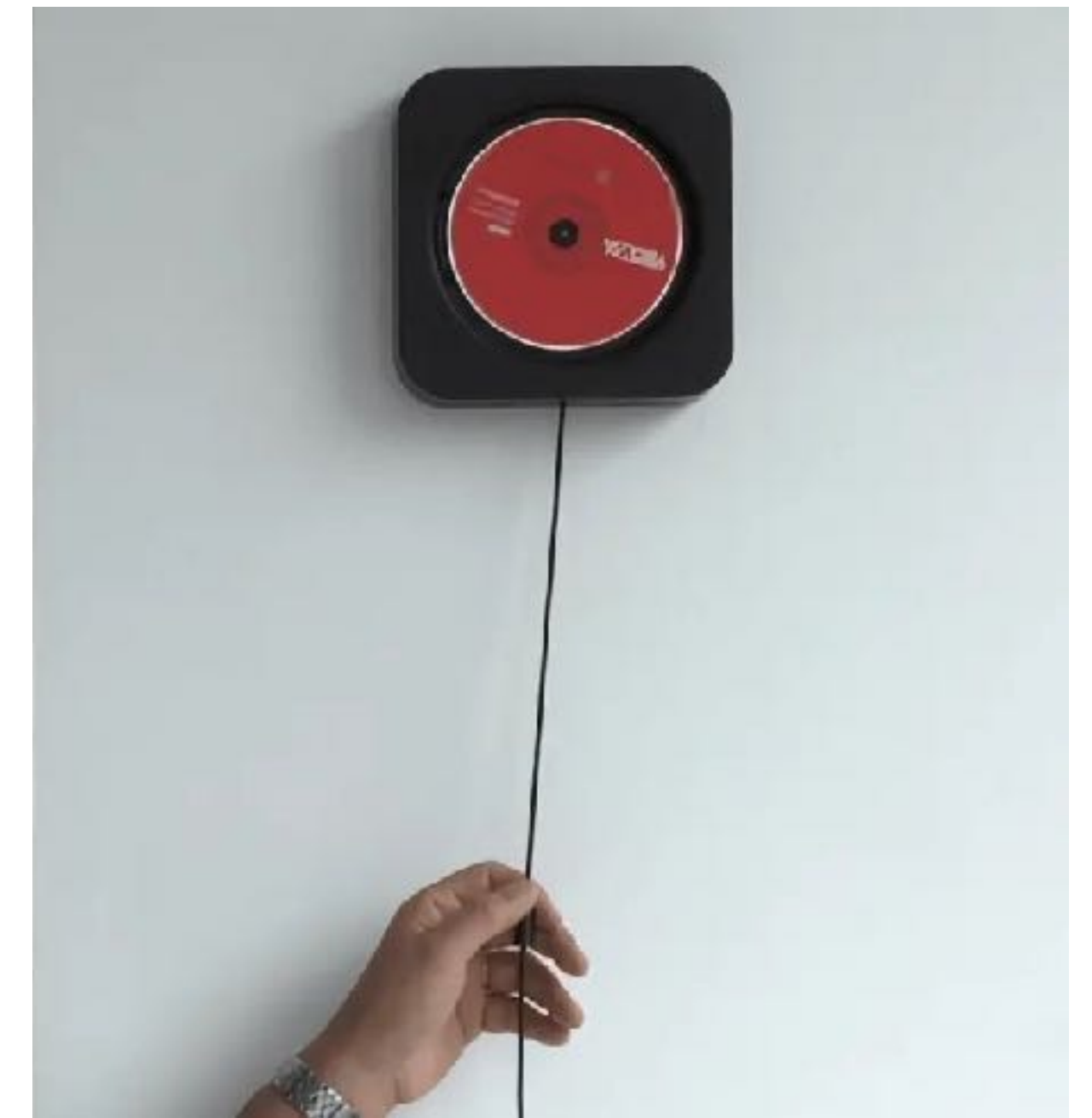
Фукасава. Лифт и CD плеер