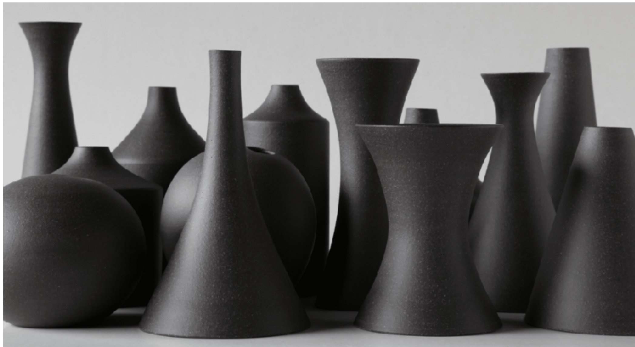
Ногими Фиджи. 2021.

Это проектирование «революции», превращение хаоса в порядок