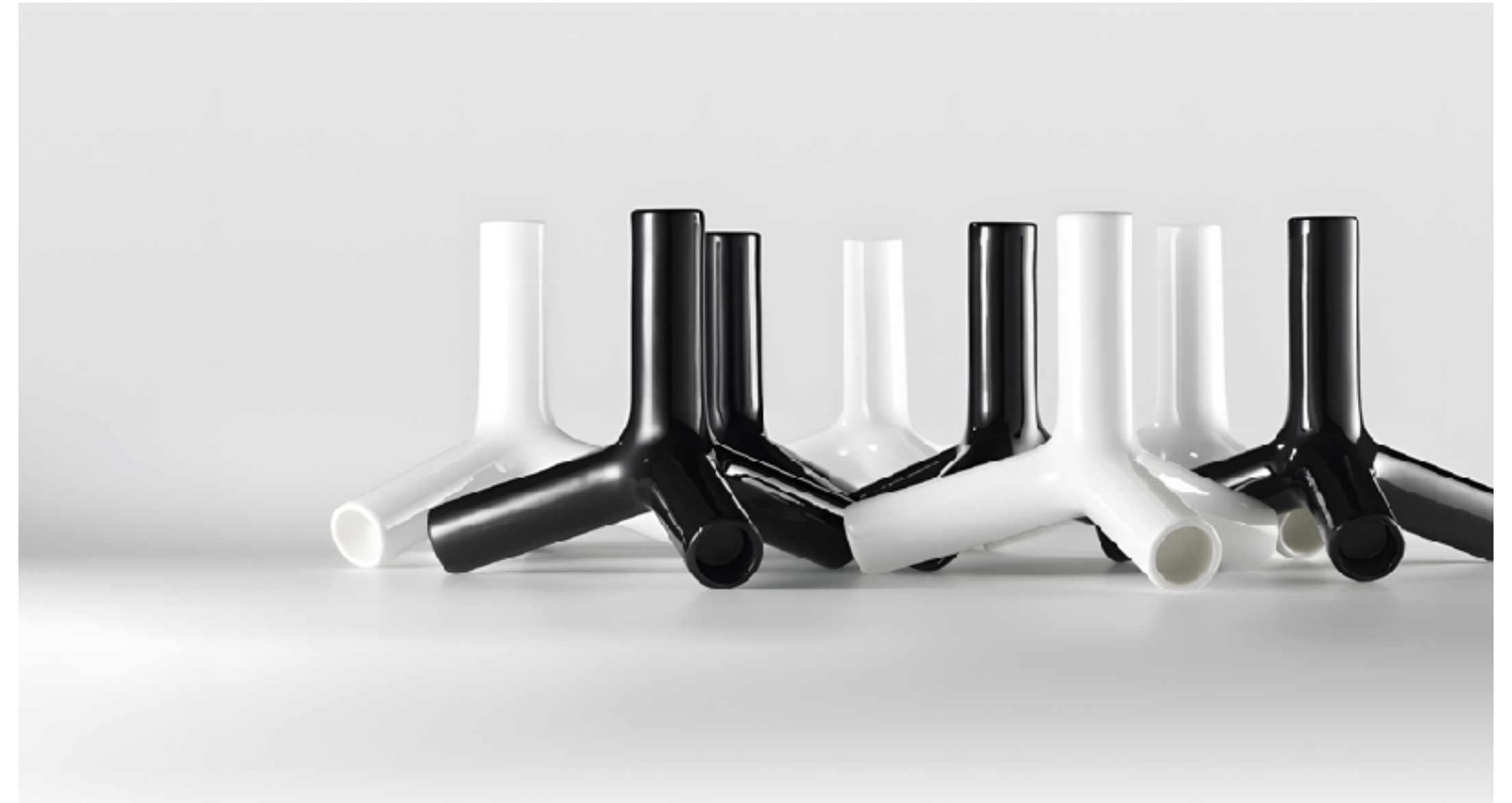
Наото Фукасава. 2005.