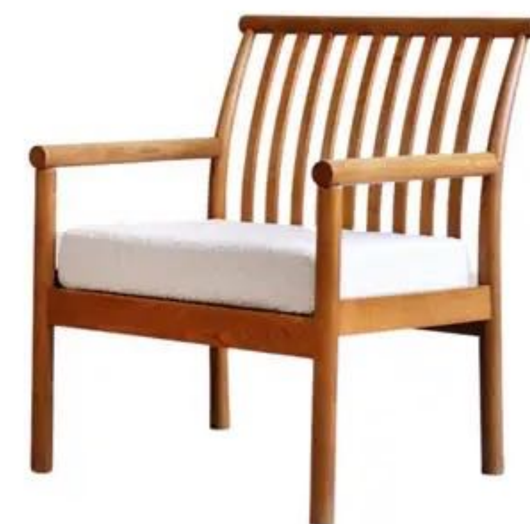
Исама Кэнмоти. Armchairs 60-е